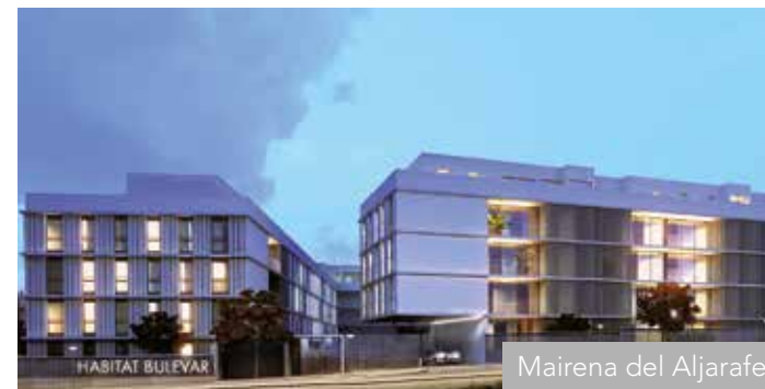
Mairena del Aljarafe