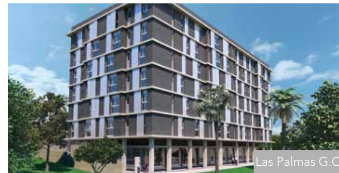
Las Palmas G.C.